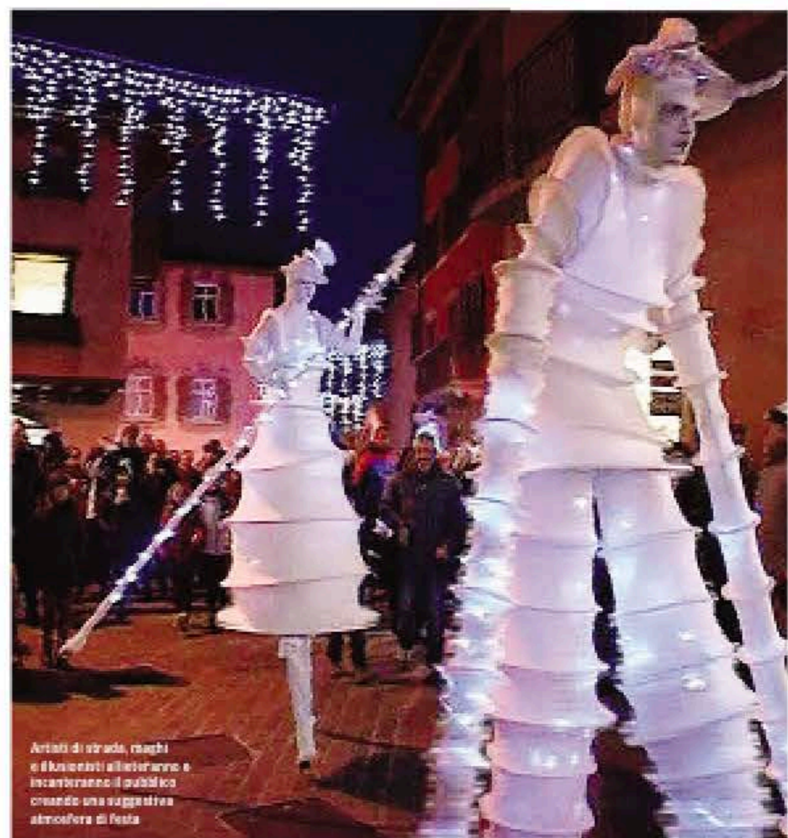
Artisti di strada, maghi e illusionisti incanterano e incantano il pubblico creando una suggestiva atmosfera di festa